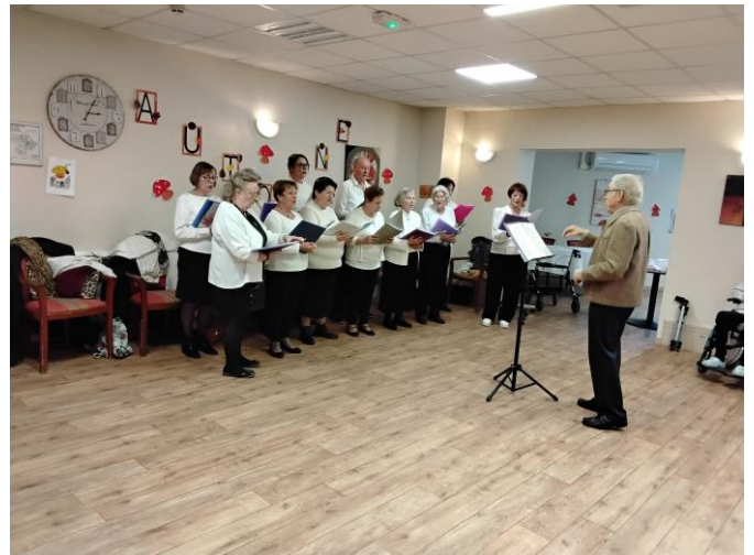
« Les vieux chanteurs à la canne de bois »