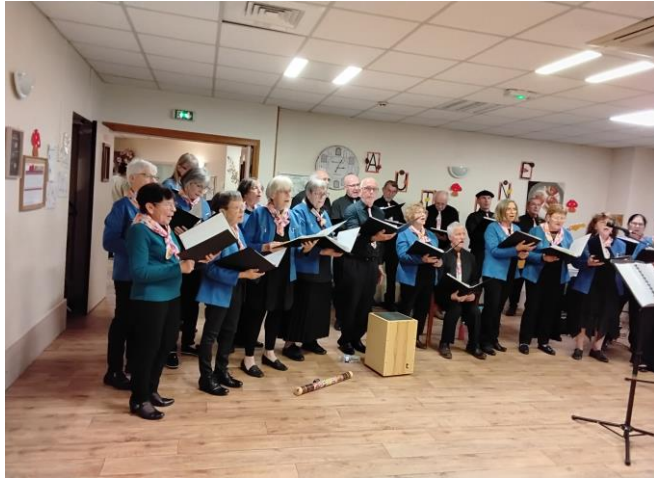
« le cœur des fontaines »